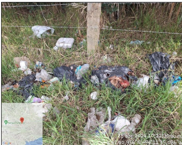
Ilustración 2. Inadecuada disposición de residuos.

C.P.250020 Tel. +57(1) 823 40 70 823 40 71 / 823 40 73 Fax. + 57(1) 825 76 20 Dir. Cra. 14 No. 13-05