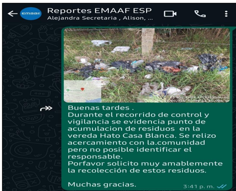
Ilustracion3. Reporte EMAAF